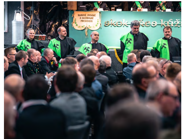
Fuxové čekají na skok přes kůži.

Druhého prosince 2022 velký sál PZKO ve Stonavě zaplnila slavná sese. V čele zasedlo Slavné Vysoké a Neomylné Presidium, které během večera přijalo nováčky lišáky, neboli fuxe do hornického stavu. Celý program se nesl v duchu více než 100leté tradice, kterou havíři stále drží a ctí. K průběhu firemního šachtáku se vrátíme ještě v lednovém vydání Horníka.