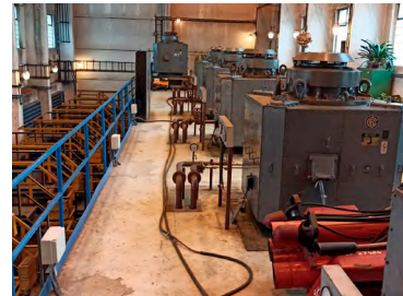
O provoz se starají povrchoví elektrikáři.

po zrušení energodispečinku vyřizují požadavky na dopravu osob a materiálu pro povrchové proozy mimo ranní směnu, řeší monitoring dodávek energetických komodit přes systém SGS Energetika. V zimním období budou rovněž řídit i odklízení sněhu na jednotlivých lokalitách ve spolupráci s dodavatelskou firmou.