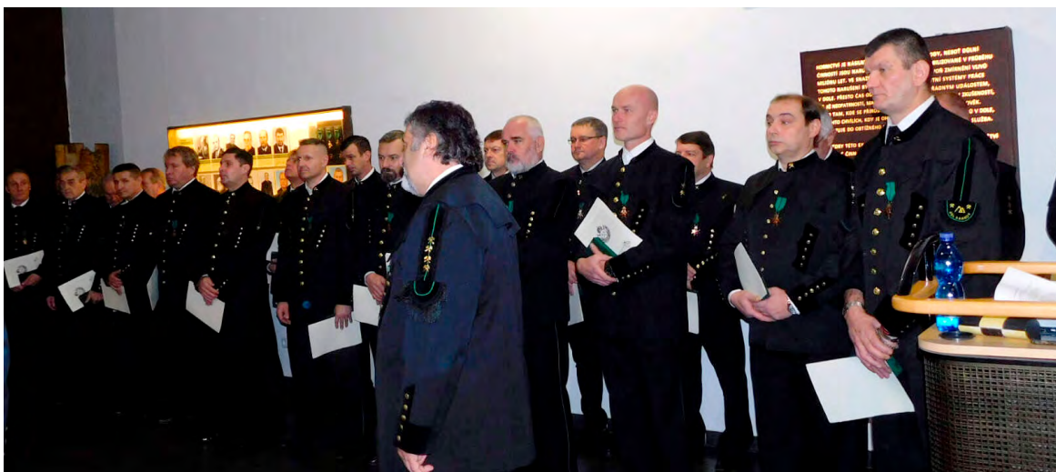
Vyznamenání proběhlo v síni tradic v záchranné expozici v Ostravě na Landeku.