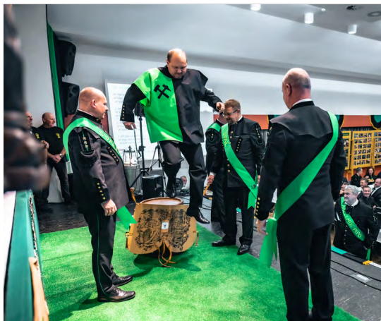
Vstup do cechu hornického.