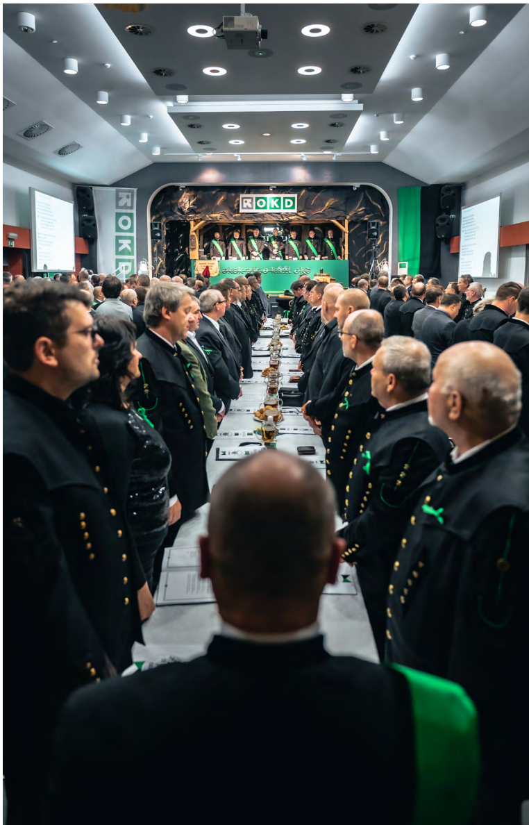
Slavná sese OKD.