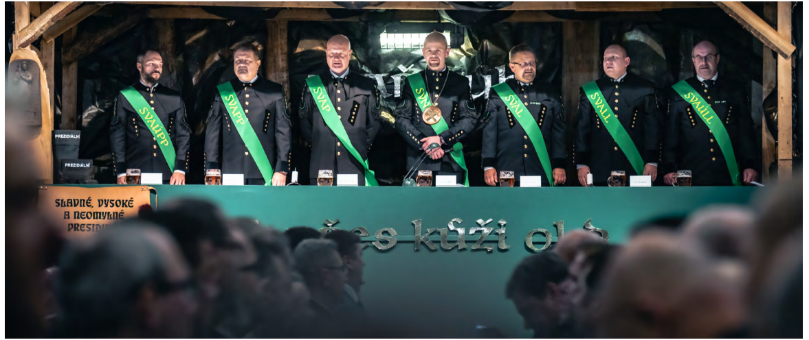
Presidiální tablice v čele se Slavným, Vysokým a Neomylným Presidiem (SVNP).