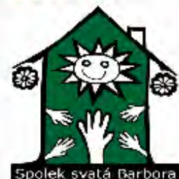
Spolek svatá Barbora

Spolek svatá Barbora děkuje všem laskavým dárcům a přejeme klidné Vánoce a v novém roce zdraví, štěstí pohodu!