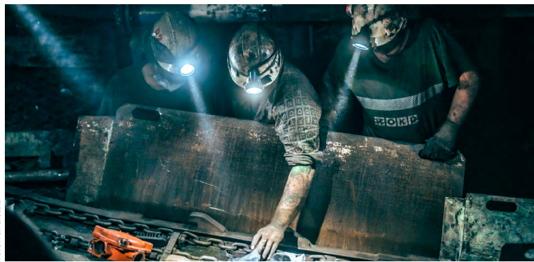
Bezpečnostní krédo v OKD: Kolik lidí sfářalo, tolik musí vyfářat.