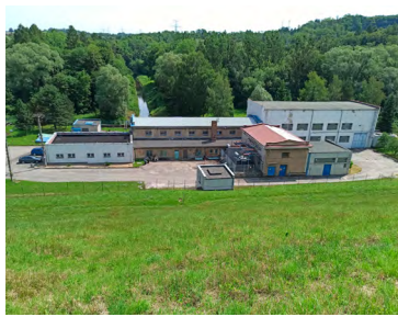
Čerpací stanici provozuje OKD.

Kdepak, vždyť v letech 1955 až 1964 byla budována právě za účelem zásobování šachet na Karvinsku a také železáren v Třinci právě provozní vodou. Kvůli jejímu vzniku se dokonce tehdy zatopila část obce Těrlicko a navíc i část silnice I/11 z Ostravy do Českého Těšína – na jižním okraji přehrady postavili novou přeložku této cesty. A k dalším účelům údolní nádrže v Těrlicku patří povodňová ochrana níže ležících území, nadlepšování minimálních průtoků ve Stonávce pod přehradou a samozřejmě také ono zmiňované využití k rekreaci.