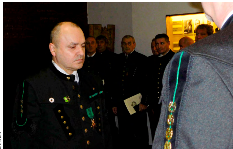
Závodní stonavské šachty dostal zlatý kříž.

Střednědobý výhled těžbařů vnímal jako velmi realistický. „Z mnoha důvodů, jako je například technologické zázemí, stav příprav či personální kapacity, však nedává smysl další těžba po roce 2025,“ prohlásil.