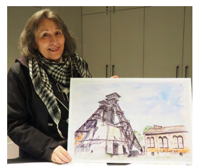
Malířka a též nová členka s kalendářem.

Následovalo společné fotografování všech účastníků na pódiu kulturního domu. Každý pak dostal mj. kalendář Těžní věže 2023, jenž každoročně vydává a zpracovává Nadace LANDEK Ostrava. Ten vy-