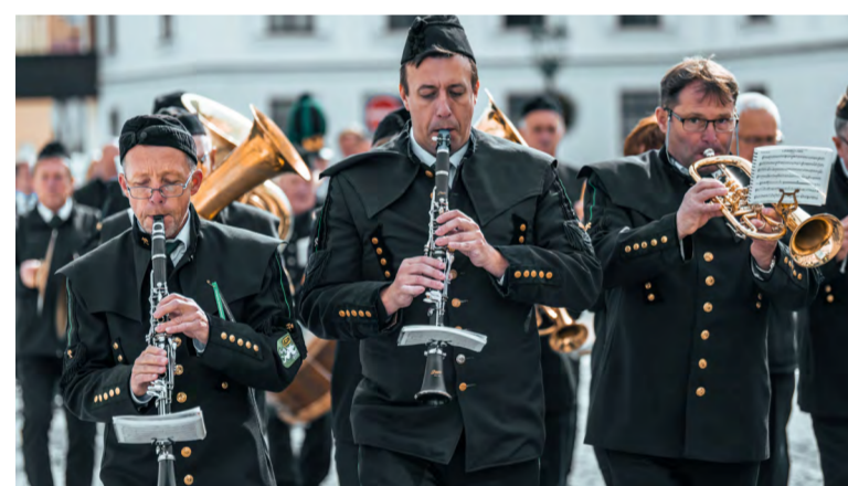
Úvodem zazněla Hornická hymna.

Ten také mezi prvními položil věnec k pomníku hornických obětí u Slezské univerzity. Poté se účastníci pietního aktu, doprovázeného hudbou havířské dechovky Akordanka, vypravili v průvodu do kostela Povýšení Svatého Kříže na mši za zemřelé i žijící generace horníků. Mezi hosty oficiální části programu byli také zástupci PRISKO, města, kraje i firem, které dlouhodobě s těžební společností spolupracují.