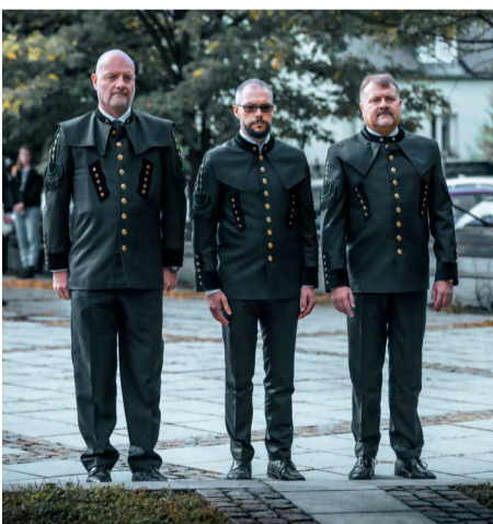
OKD uctila hornické tradice a vzdala hold havířům, kteří při práci pod zemí zahynuli, sloužila se za ně i mše v kostele.