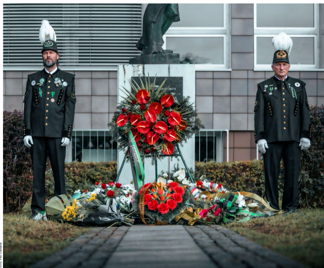
Čestná stráž u pomníku hornických obětí.

„Chtěl bych se dotknout i slov jako: respekt, obdiv, úcta, pokora, ale též strach, obava, únava a hlavně naděje. To jsou, podle mého názoru, pojmy charakterizující pocity každého, kdo někdy pracoval pod zemí. Tyto pocity znají i rodiny a blízcí těch, kteří se rozhodli do hor-