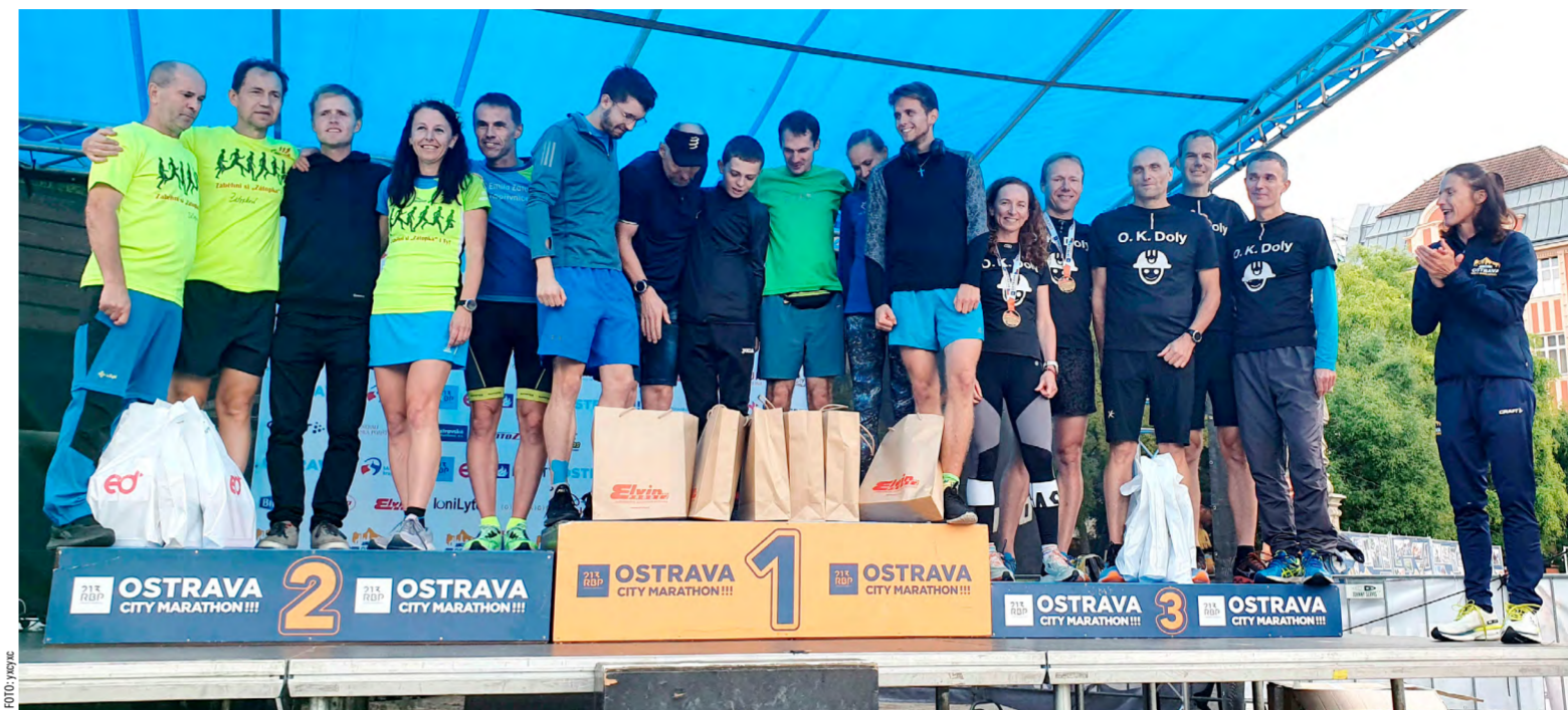
O.K.Doly se umístila i na stupních vítězů.

Ostrava – Na třetí příčce mezi celkem šestadesáti smíšenými firemními štafetami na RBP Ostrava City Marathonu byla ta s názvem O.K.Doly. Tvůřili ji samozřejmě běžci z OKD a její celkový čas činil 2 hodiny 50 minut a 33 sekund. Svůj úspěch ještě zamě- stnanci těžební společnosti korunovali sedmým místem v absolutním pořadí všech sedmadesáti štafet.