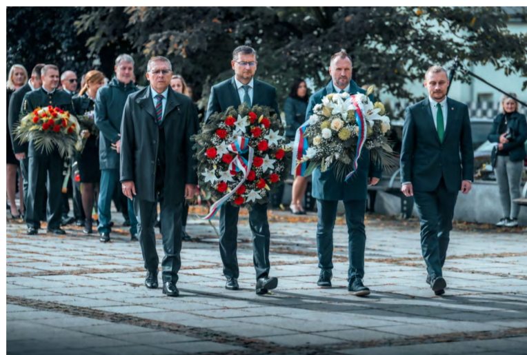
Památku uctili také zástupci MS kraje a města Karviná.

Produkce z Dolu ČSM, jak Sikora upozornil, slouží k zajištění tepla i světla pro podstatnou část obyvatel. Což způsobilo, že hornický stav na Karvinsku nezankl, na stonavské šachtě zůstalo pracovat na tři a půl tisíce lidí, díky nimž hornické řemeslo je stále živé. Byť dělat v něm znamenalo a znamená každodenní boj