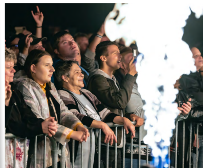
Atmosfera pod pódiem.