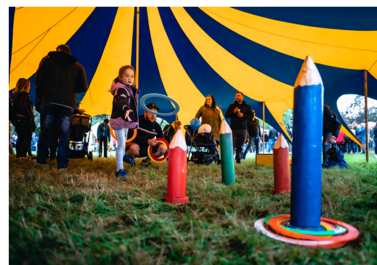
Šapitó, dominanta Nadačního městečka.

Letošní dominantou Nadačního městečka se stalo obrovské šapitó, kde pro návštěvníky měli obruce, balanční desky, puzzle či házení míčů do klaunských hlav. Nesmělo chybět taky dětem oblíbené malování na obličej nebo permanentní tetování, skákací hrady, jízda na ponících a fotooutek, který zveřejnil nespočet rodin,“ pokračovala nadační referentka.