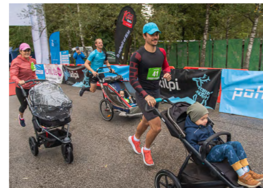
Běh rodičů s kočárky.

Nastíhala také další plány: V roce 2023 hodlají organizátoři do uni- kátní pohornické krajiny do- stát rovnou Mistrovství ČR v běhu na 50 kilometrů.