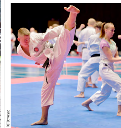
Na přípravu karatistů přispěla Nadace OKD.