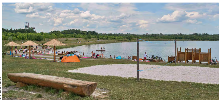
Trasy povedou okolo Karvinského moře.

Revírní pohodová padesátka otevírá online registraci na webu https://www.poho50.cz/ , a to do 11. září do 23:59 hodin. Dále se bude možné přihlásit na místě prezentace závodu v neděli 18. září v karvinském Parku B. Němcové od 9 do 11 hodin. Padesátikoruna z každého startovního jde na dobročinnou aktivitu spolku Madleine. Účastníci zapsaní do 5. září mohou počítat s pamětními medailkami, veškerým servisem (elektronické měření časů i mezičasů, občerstvení na trati, SMS výsledky, zázemím s toaletami, depozitem věcí), chybět nebude ani doprovodný program.