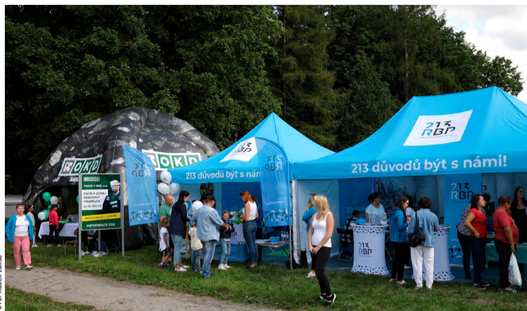
Zdravotní pojišťovna RBP se účastnila i v minulých letech karvinských hornických slavností. Ve svých Stanech zdraví RBP provádí zdarma měření fyzické kondice a některých dalších funkcí.

Snad jen pro úplnost připomenul, že pojištěnci mají nárok jednou za dva roky na všeobecnou preventivní prohlídku u praktického lékaře (děti do tří let u praktického lékaře pro děti a dorost častěji, od tří let pak rovněž ve dvouletých intervalech), ženy od patnácti let každoročně na gynekologickou prohlídku a všichni pak dvakrát ročně na stomatologickou preventivní prohlídku. „Součástí prevence jsou v návaznosti na věk a pohlaví různé screeningové programy, například screening nádoru prsu prostřednictvím mamografie, konečníku a tlustého střeva, nádorů děložní-