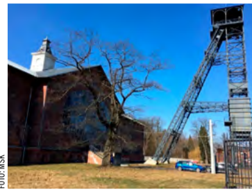
Důl Barboř bude místem zajímavého prázdninového festivalu.

KARVINÁ – Kultura, sport, odpočinek, zábava i návrat do hornické minulosti. Takové bude Léto na Barboře, kdy čeká na návštěvníky na někdejší šachtě ve čtyřech červencových a čtyřech srpnových víkendech bohatý program.