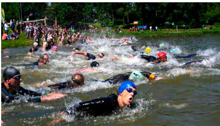
Brušperský extrémní triatlon se letos konal podvacáté.

Krásný závod, jehož dospělá kategorie čekaly disciplíny osm set metrů plavání, osmdesát kilometrů jízda na horském kole (trasa vedla i okolo Dolu Staříč) a čtyřkilometrového běhu, si nakonec užili všichni startující. „Důležité bylo, že se vše obešlo bez vážnějšího zranění, a tak můžeme s dobrým pocitem uzavřít dvacetiletou historii jednoho z nejpopulárnějších triatlonů v regionu,“ zakončil Holanik.