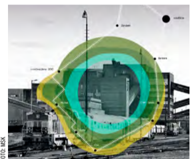
Báňské spěšné vlaky opět jezdí revírem.

„Výtěžníci si prohlédnou například monumentální železný věž typu Walsum u Dolu Barbora ve staré Karvině, pokochají se impozantním výhledem na Důl Darkov, dozví se třeba, proč dnes jáma Žofinka v Orlově slouží jako vodní nebo při troše štěstí narazí na horníky na posledním