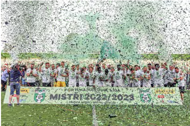
MFK Karviná oslavuje návrat mezi nejlepší české týmy.

KARVINÁ – Městský fotbalový klub (MFK) v jubilejní dvacáté sezoně dokázal s generálním partnerem, společností OKD, splnit svůj hlavní cíl: Karviná se pro sezonu 2023/2024 stane městem, kde se bude hrát nejvyšší česká fotbalová soutěž! Áčko v zeleno-černých hornických barvách skončilo na špičce druholigových tabulek s šestapadesáti body a o čtyři překonalo druhý Vyškov. Zahanbit se ostatně nenechalo „běčko“ ani dorostenci U18, kteří taktéž získali tituly.