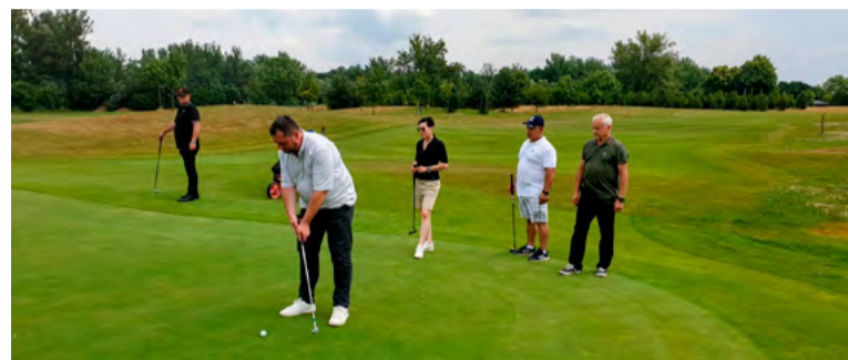
Horníci hráli na jednom z "top" českých hřišť.