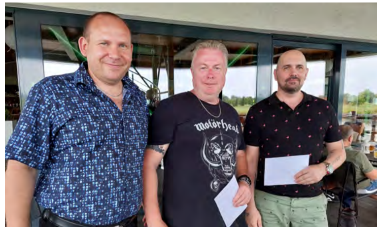
Vyhlášení nejlepších v Texas Scramble.

řejném hřišti, pro který byla návštěva z OKD rozdělena do flajtů (týmů) po čtyřech či pěti. „Začíná se na odpališti, kde postupně celý flajt odpálí míček. Poté se vybere ten nejlepší odpal, pozice míčku, a z tohoto místa zase hrají všichni další ránu. Počítá a zapisuje se počet ran, který flajt na každé jamce dosáhl,“ vysvětloval Dedek. Všichni účastníci se při hře dobře bavili, natrénováni základy golfové hry a někteří odcházeli rozhodnutí tyto základy i dál rozvíjet!