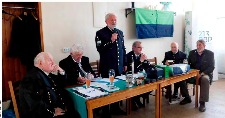
Předsednictvo výroční členské schůze KPHMO.