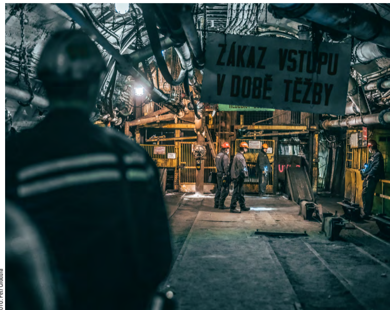
Podmínky nebyly ideální, ale na režim v těžbě se dosáhlo.

Petr Glas, šéfujiící provozu příprav, navázal se situací na čelbách v OKD: „Ve čtvrtém měsíci jsme vyrazili rovného půl kilometru, tím jsme překro-