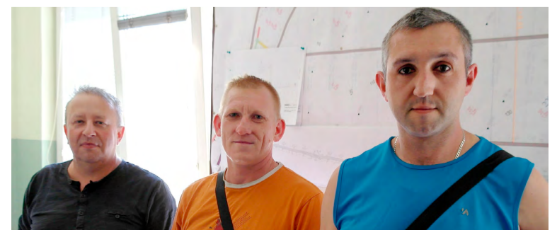
Nadštájr (zleva), kombajnový specialista a zastupující hlavní předák.

„Denně teď kopeme v průměru tisíc tun čistého uhlí bez průvodních hornin,“ oznámil vedoucí úseku. Horníci z Alpexu by měli ve stěně 292 207 kopat do konce tohoto roku a celková těžba odtud byla plánována na 221 tisíc tun.