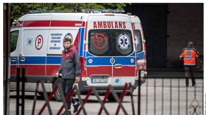
Vozy báňských záchranářů na KWK Pniówek.

Na šachtě Borynia-Zofiówka Ruch Zofiówka došlo v sobotu 23. dubna opět časně nad ránem k silnému důlnímu otrusu s energií 4x10 J, spojenému i s intenzivním vývinem metanu. Stalo se to během ražby a provádění dlouhých vrtů pro thací práce na čelbě D-4a přibližně ve štuře 900 metrů. Z dvaapadesáti horníků v oblasti se dvačtyřicet zachránilo vlastními silami. Deset jich našli záchranáři po smrti, jejich akce byla rozdělena na čtyři etapy, museli mj. vyčerpávat vodu z chodby. Záchranná akce byla na této lokalitě ukončena ve středu 27. dubna odpoledne.