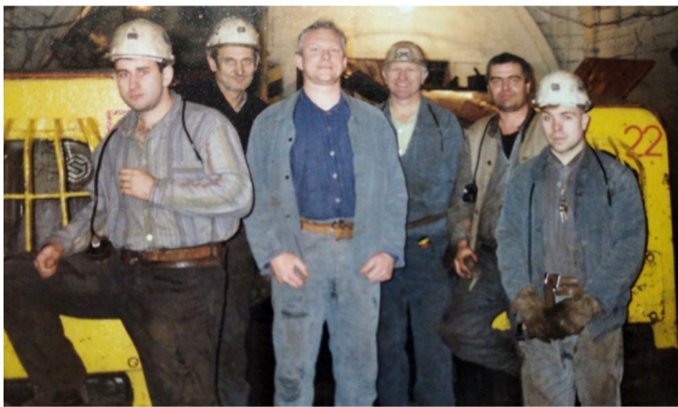
A v minulosti s kolegy z dopravy na Dole ČSM (uprostřed).