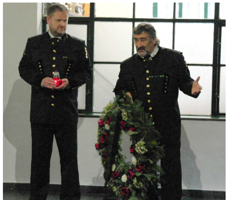
Uctění památky záchranářů, kteří při práci položili své životy.