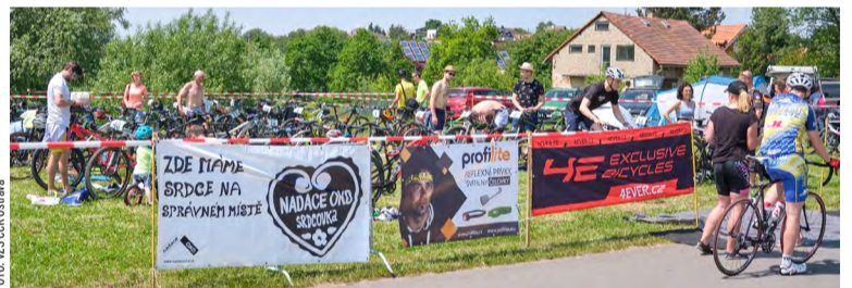
Srdcovka znamená tradiční podporu.