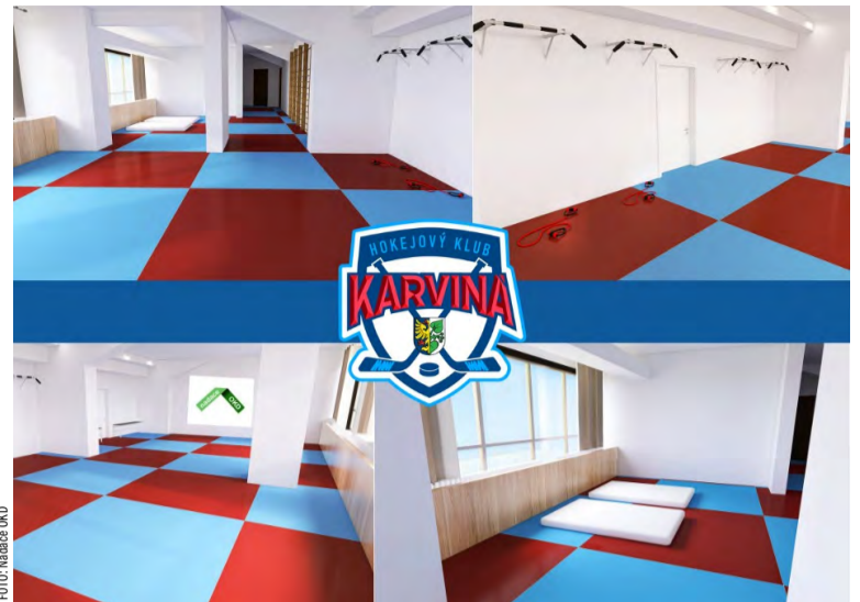
Vizualizace budoucí tělocvičny.

„Za naši republiku nastoupilo na slovenském mistrovství veteránů pět judistek a pětatřicet judistů,“ shrnul Tamáš. S tím, že na sportovní část navázala společenská, kdy se večer setkala kompletní výprava oslavující společně nejen úspěchy, ale i setkání po roční přestávce. Judisté poznávali i krásy Slovenska.