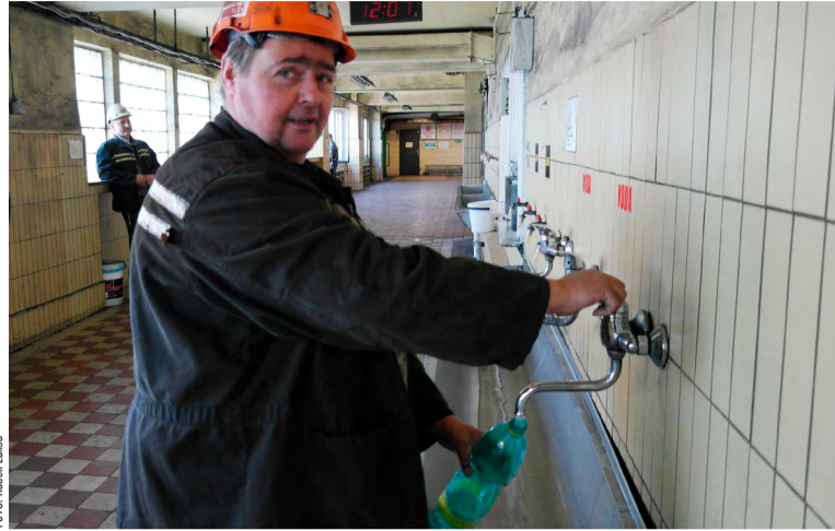
Zavodnění, příprava na šichtu.