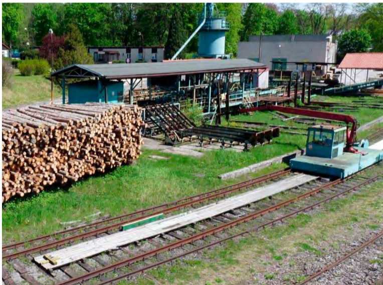
Dřevo pro revír pochází zejména z Jeseníků.

„Vloni vyrobili na Salmě pro potřeby důlních v našem revíru 5138 kubíků