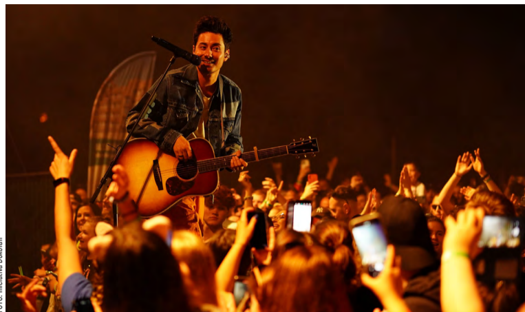
Majáles se konal znovu na Lodičkách.

A jak lídr asi dvacetiletého týmu Dokořán upřesnil, nic z toho by se neobešlo bez Nadace OKD: „Je od samého začátku naším primárním partnerem, po městu druhým největším. Její pomoc je pro udržení chodu Lodiček zásadní, jinak bychom to asi sotva zvládali.“ Iniciativa Dokořán