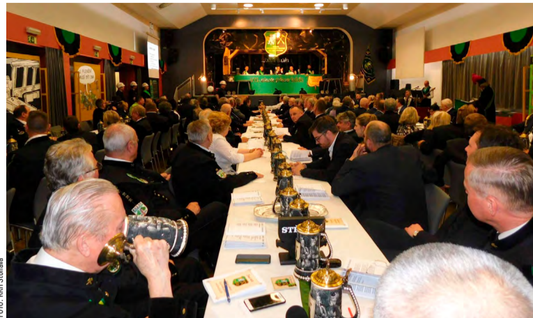
Sesse krojovaných horníků ve Stonavě.