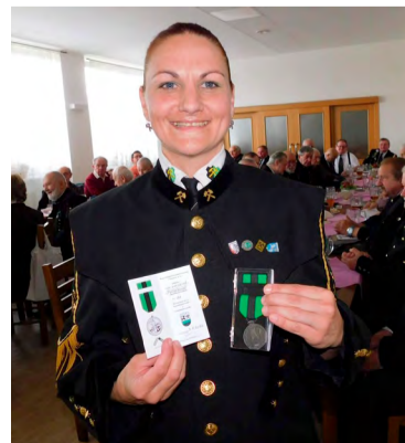
Klub vyznamenal i dámy.