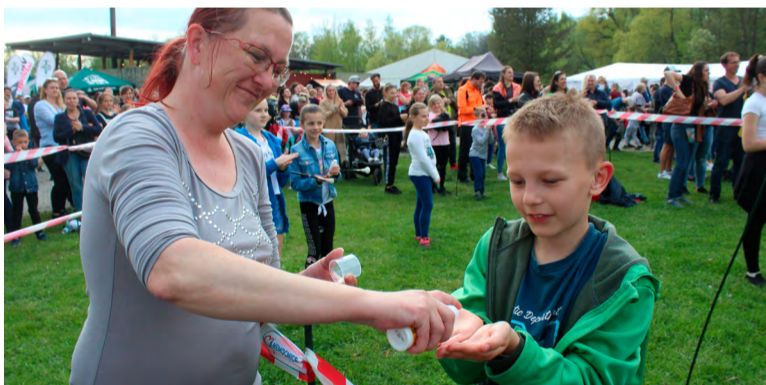
Účastníci dezinfekčního rekordu v Karvině.

Celkem 2045 lidí z dezinfikovanými dlaněmi se se bavilo i při dalším programu (prezentace karvinských volnočasových aktivit, gastro-zóna, vystoupení Marka Ztraceného). Na prevenci cílily také orientační měření zraku, zjišťování krevních skupin, či vyšetření podoskopem. Den zdraví měl za partnera mj. zdravotní pojišťovnu RPB 213.