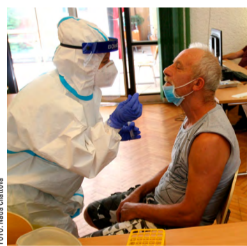
Testování zaměstnanců v době koronavirové pandemie.