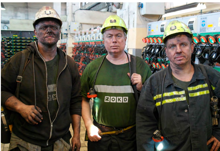
Zastupující hlavní předák (zleva), vedoucí úseku, mechanik úseku.