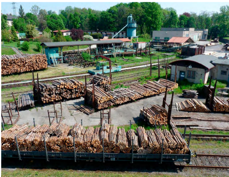
Vloni odtud odjelo do revíru 5138 kubíků dříví.

„Ačkoliv je tento provoz mimo lokality Dolu ČSM, patří k nedílné součásti zajištění služeb odboru řízení povrchů spojených s těžbou uhlí i bezpečností,“ poznamenává Čechák. Co se externího prodeje produktů z Pily Salma týče, vloni odtud firmy nebo soukromníci nakoupili okolo 900 kubíků palivového dříví a 780 kubíků řeziva.