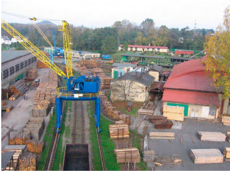
Areál provozu v Ostravě-Hranečnicku.

STONAVA – Salmovec pojmenovaný samozřejmě po jámě Salm (poté Ingát) a jejím majiteli, knížeti Hugu Salm-Reifferscheidtovi, je ve Slezské Ostravě místem, kde už devětašedesát let působí centrální výroba i sklad důlního dříví pro OKD. V dnešní době spadá pod odbor řízení povrchů. Podrobnosti o fungování Pily Salma přináší vedoucí provozu povrchových služeb Luděk Čechák.