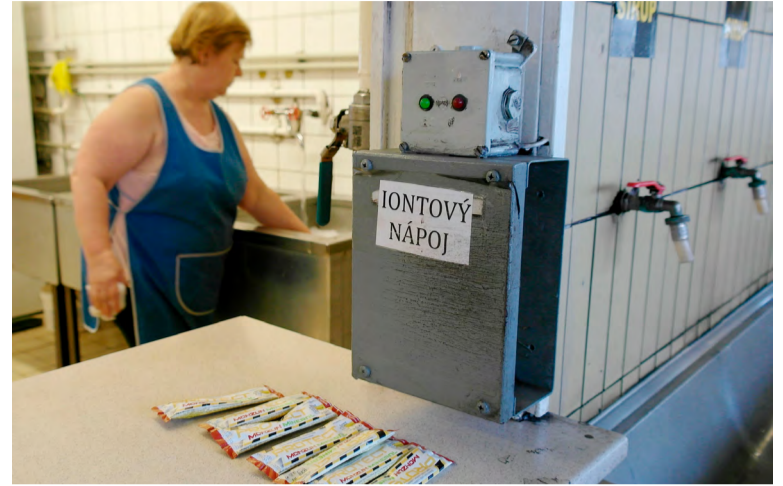
Vhodným doplňkem jsou iontové nápoje.