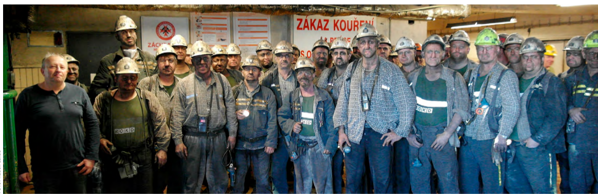
Ranní směna horníků z Alpexu dobývajících porub 292 207 na Severu.