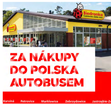
Plakát na mezinárodní autobusovou linku.

Z týmu těžařské nadace vzkazují, že projekt podpořený v programu Pro region 2023 má za cíl propojit města v příhraničním regionu, zpřístupnit lidem cestování za prací, nákupy, kulturu, relaxaci i sportem a podpořit turismus.