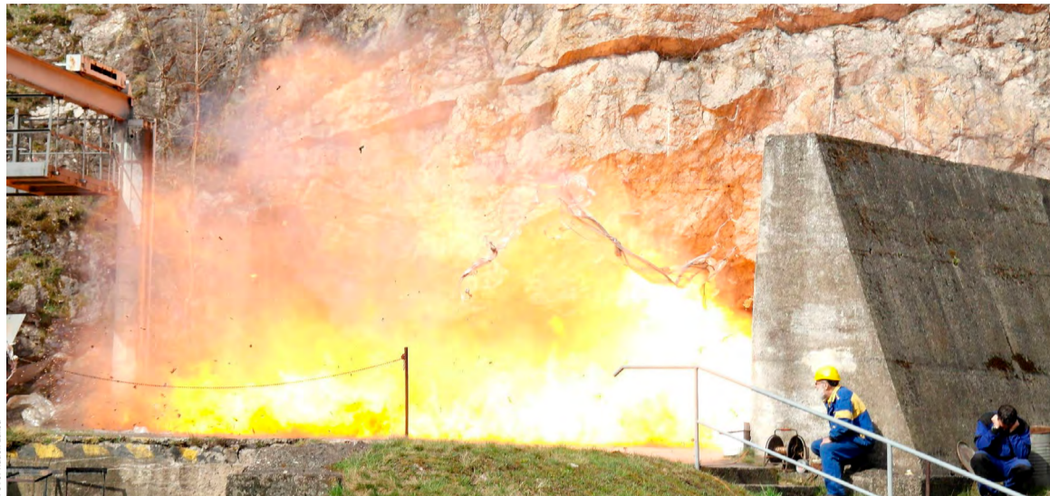
Výbuch metanu pod kontrolou odborníků před štramberskou cvičnou štolou.

správnou funkci zařízení pro rozvod větrů, tj. uzavření a neporušenost hrázových objektů, větrních dveří, větrních přepážek (plent) apod., ověřit chod ventilátorů separátního větrání, ▪ zajistí zastavení veškerých prací v ohrožené oblasti a povolí pouze práce na odstranění zjištěného stavu