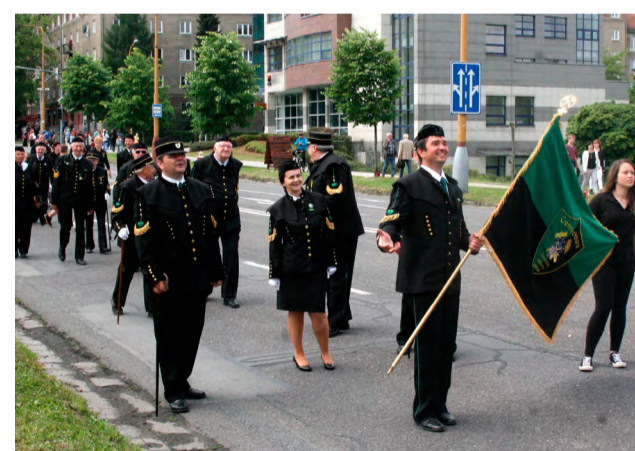
Slavnostní průvod z roku 2015 v ulicích Havířova.

OSTRAVA – Druhý zářijový víkend, od pátku 8. do neděle 10., bude Ostrava hostit velkou slávu: 27. setkání hornických měst a obcí (SHMO) ČR. Vcelku logickým partnerem této akce se stala i společnost OKD.