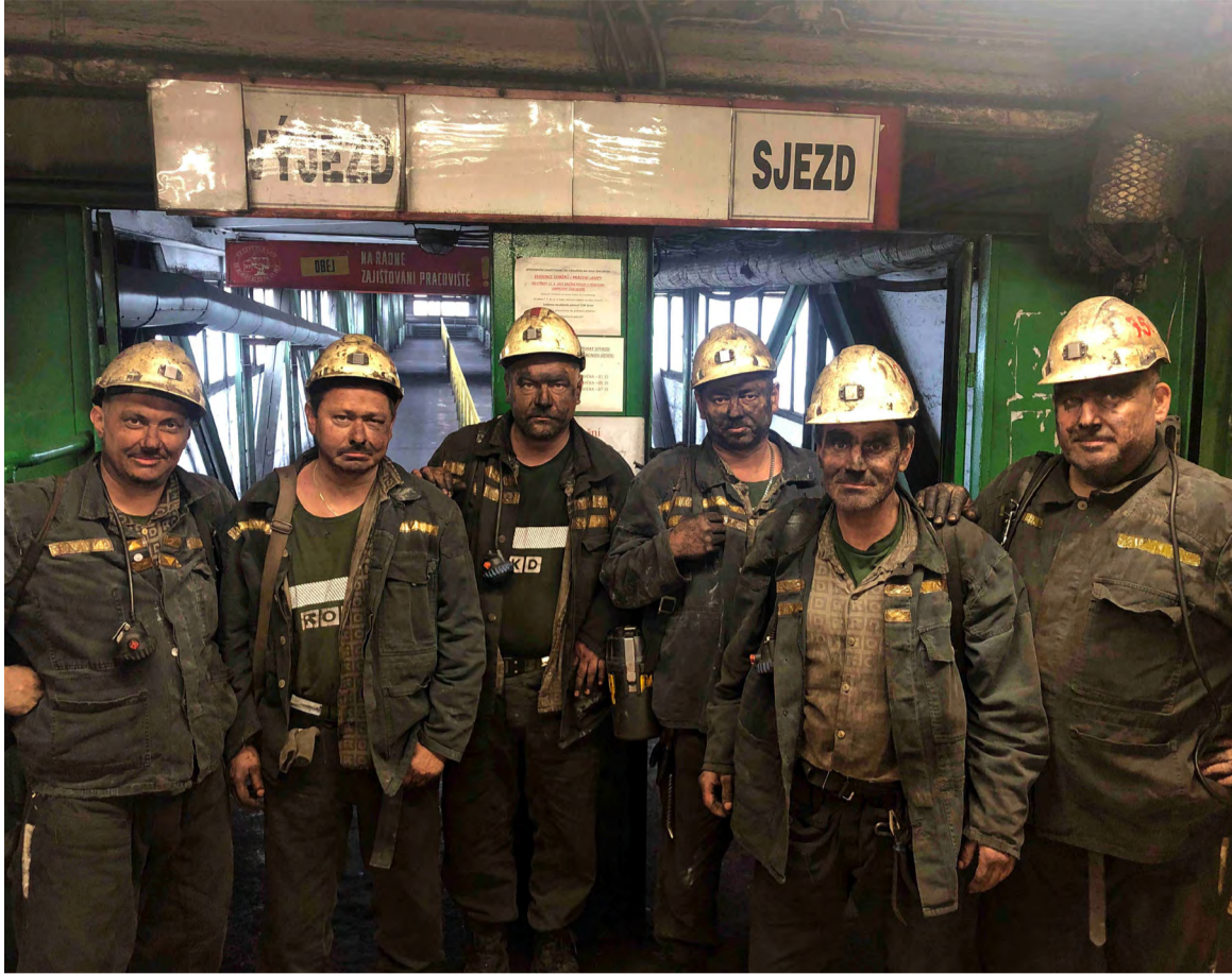
Hlavní předák (třetí zleva) s částí ranní směny kolektivu.