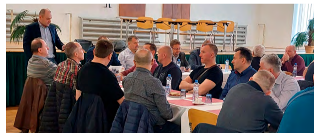
Slovo dostal na poradě i závodní Dolu ČSM.