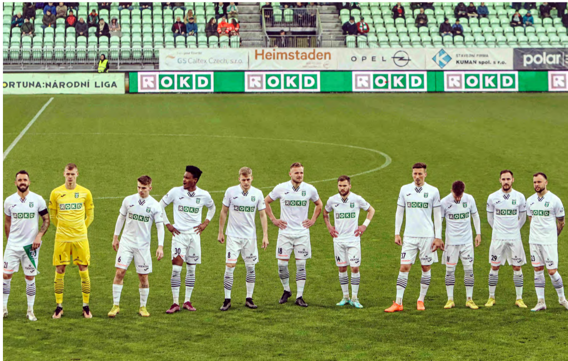
Karvinští fotbalisté na domácím hřišti.

KARVINÁ – Jen docela nešťastná plichta s Líšní kazí jarní sezonu pro fotbalisty Karviné, kteří do ní vstoupili se společností OKD coby generálním partnerem. MFK se jinak dostal do čela FORTUNA:NÁRODNÍ LIGY, kterou vede šest zápasů před koncem o bod. Teď je čeká v pondělí 1. května slezské derby v Opavě a v neděli 7. května doma zápas s Prostějovem.