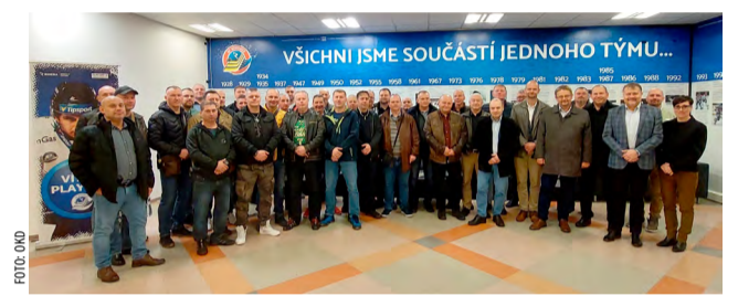
Horníci z OKD na exkurzi v Ostravar Aréně.

Začínalo se, jak tomu bylo u předáckých porad v revíru dříve zvykem, na jiných pracovištích. Konkrétně na úpravě na severní lokalitě Dolu ČSM. „Po třídvaceti letech na šachtě jsem byl na pradle fakt poprvé. Sice