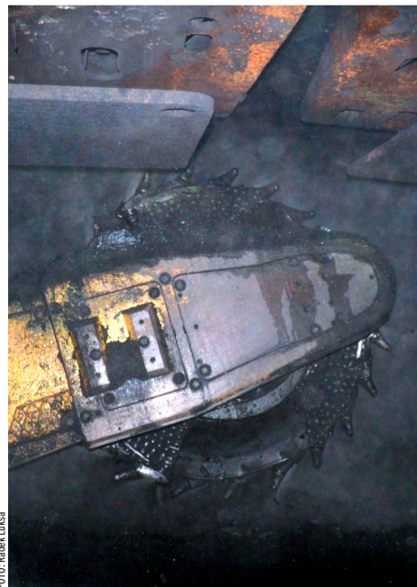
Univerzál pro všechny sekce i porubové dopravníky.

Nastínil také historii provozu dobývacích kombajnů na Dole ČSM. „Kopalo se se stroji domácí produkce, jako byl typ KSV-6 vyráběný Ostrojem Opava. Poté ruskými KŠ 1KG, které byly v provozu v sedmdesátých a osmdesátých