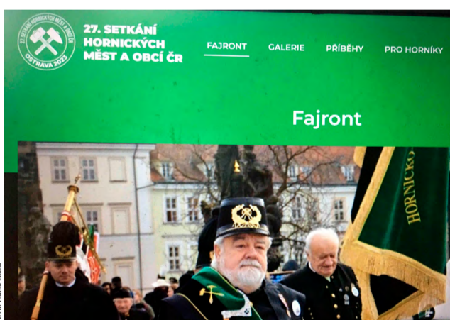
Letošní velká hornická sláva se uskutečnila v Ostravě.