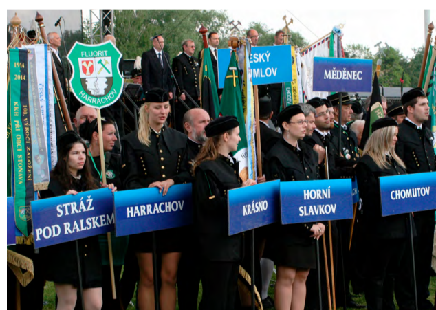
V regionu se naposledy konalo setkání v Havířově.