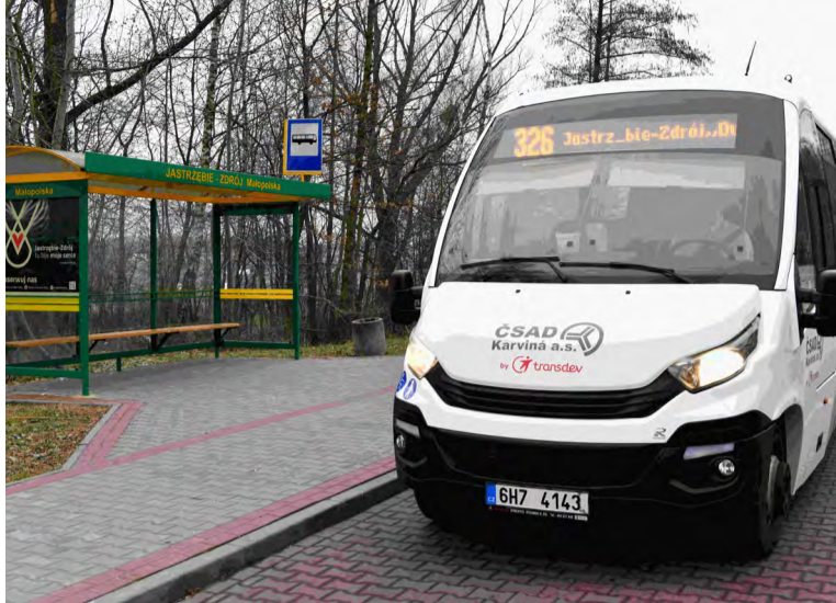
Mezinárodní autobusová česko-polská linka.

KARVINÁ – Od dubna se opět vrací do provozu mezinárodní autobusová linka z Karviné do partnerského polského města Jastrzębie-Zdrój zajišťovaná skupinou 3CSAD by Transdev a spolufinancovaná Nadací OKD. Její minibus Iveco First s kapacitou pětadvacet cestujících je díky designovému polepu nepřehlédnutelný.